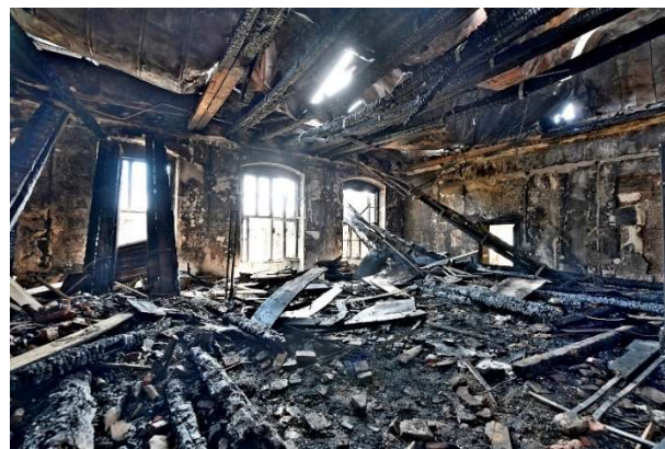
Následky požiaru – zničená štvrtá expozičná miestnosť v Berggerichte, 19.3.2023