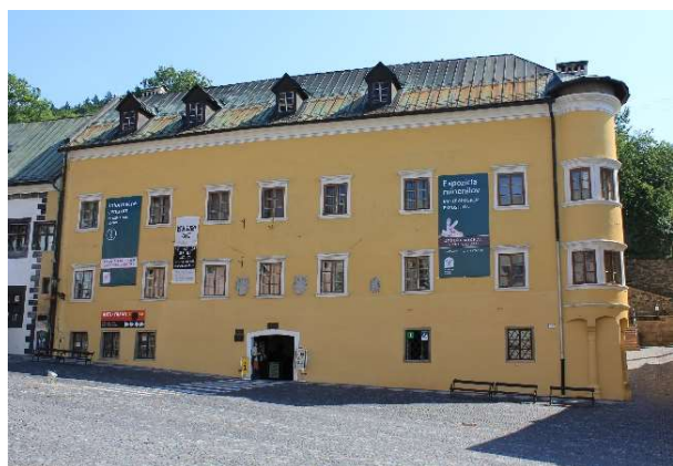
Berggericht pred požiarom

Táto tlačová správa bola vydaná Slovenským banským múzeom v Banskej Štiavnici.