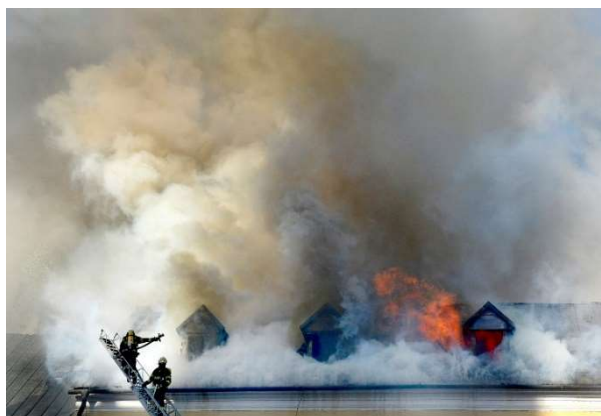
Horiaci Berggericht, 18.3.2023