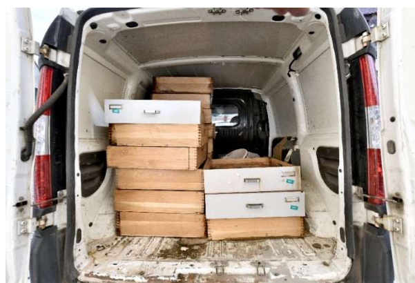
Evakuácia minerálov zo zatečených depozitárov v Berggerichte, 19.3.2023